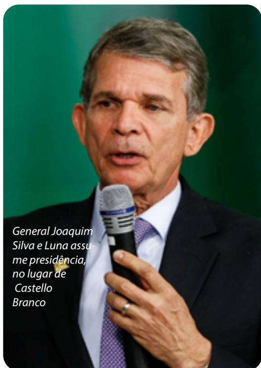
General Joaquim Silva e Luna assume presidência, no lugar de Castello Branco

O general Joaquim Silva e Luna tomou posse na presidência da Petrobrás, no dia 19, com a promessa de manter a política de privatização, retirada de direitos da categoria e o PPI (Preço de Paridade de Importação) para os combustíveis.