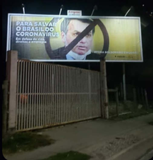
Outdoor havia sido veiculado no Urbanova e Av. Andrômeda

No último dia 26, o Sindi-petro foi alvo de um ataque à liberdade de expressão que simboliza o crescente cerceamento das liberdades democráticas no país.