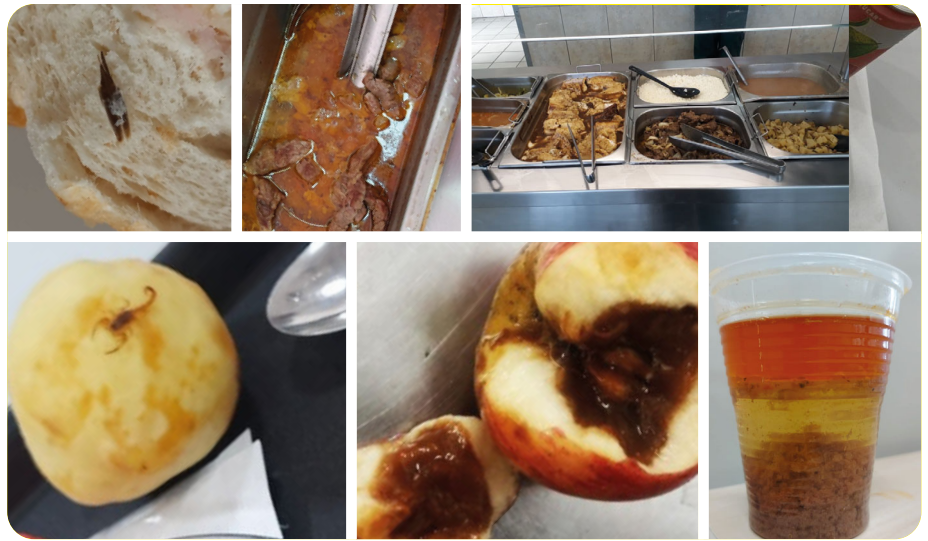
Fotos recebidas pelo Sindicato de alimentos servidos na refinaria

No entanto, Sindicato e comissão vão exigir que a proposta para uma eventual abertura de negociação com esse objetivo observe algumas condições.