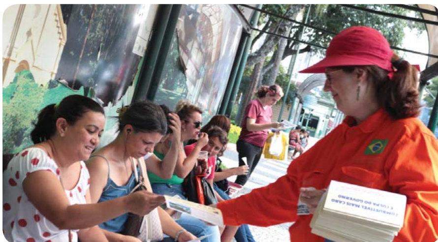
Distribuição de boletim informativo da campanha, em São José dos Campos

O Sindipetro-SJC iniciou, na última semana, uma campanha de conscientização contra o aumento do preço dos combustíveis e a privatização da Petrobrás.